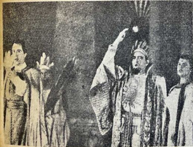
A.W. Mozart: Sihirli Fülüt operasından

Joseph Krips de programın iki modern salon - operasını idare etti: Boris Blacher: Romeo ve Julia, Benjamin Britten: Lukreçia'nın kaçırılması. Shakespear'in meşhur aşk faciasının son derecede kısaltılmış mevzuunu intihap gibi aleyhte bir unsura peşinen malik olan Blacher'in eseri musiki bakımından da fazla verimli değildi; bestekâr, yeknasaklık ve ifade mahdutluğu