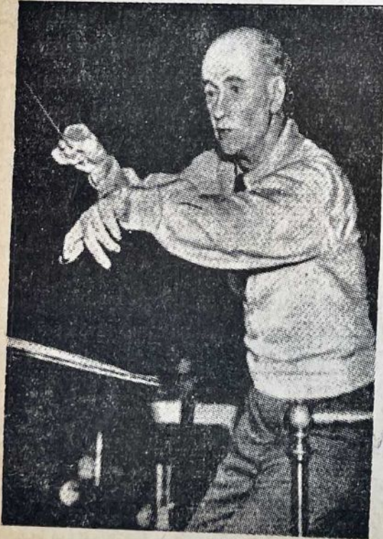
Dr. Wilhelm Furtwaengler

Festival şehri Salzburg'dan yeni döndüm. Burada tasvirine imkân göremediğim derecede nefis bir yaz, daha doğrusu musiki ile dolu bir yaz geçirmiş bulunuyorum.